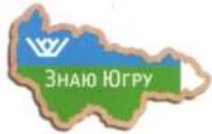
НАГРУДНЫЙ ЗНАК «ЗНАЮ ЮГРУ»

Участник должен собрать спилс-карту за установленное время.